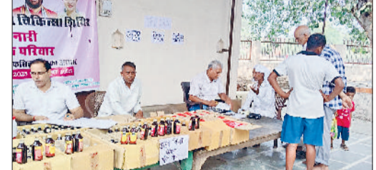
सोनीपत। लोगों की जांच करते व दवा देते कर्मचारी।