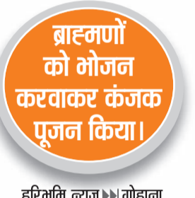
हरिभूमि न्यूज गोहाना

सुरक्षा के मद्देनजर पुलिस कर्मचारी रहे तैनात, लोगों ने की जमकर खरीदारी