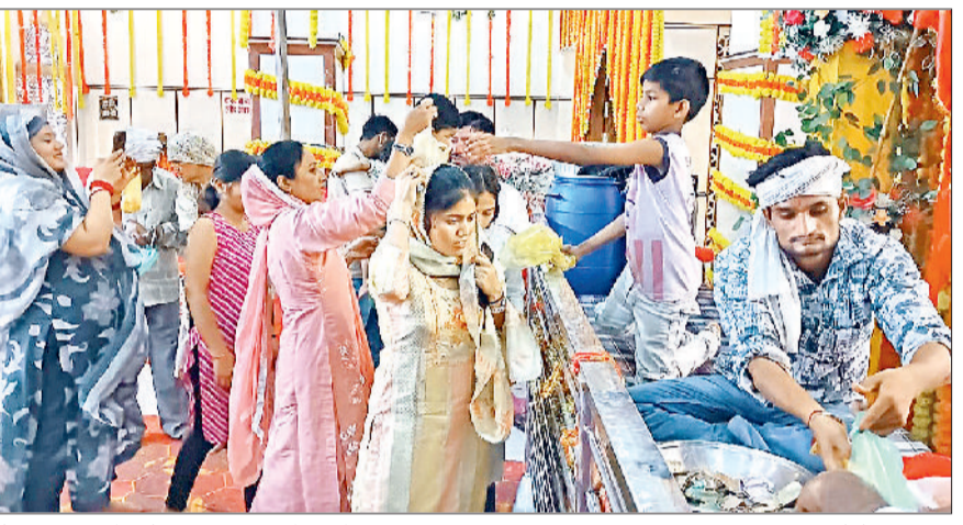
गोहाना। मंदिर में ज्योति जलाकर मन्नतें मांगते श्रद्धालु।

देवी नगर स्थित माता भीमेश्वरी मंदिर में श्रद्धालुओं की भीड़ उमड़ी। श्रद्धालुओं ने माता के दरबार में पूजा अर्चना करके परिवार और समाज में खुशहाली को लेकर मन्नतें मांगी। मंदिर में मेला भी लगा जिसमें श्रद्धालुओं ने जमकर खरीदारी की। सुरक्षा के मद्देनजर मंदिर में पुलिस कर्मचारी तैनात रहे। मेले के चलते पुलिस ने बरोदा रोड पर भारी वाहनों का आवागमन बंद किया और दूसरा रूट निर्धारित किया। माता भीमेश्वरी मंदिर में नवरात्र अष्टमी के दिन मेले का आयोजन किया जाता है। श्रद्धालु सुबह चार बजे से मंदिर में पहुंचना शुरू हो गए थे। मंदिर में आरती करवाई गई। दिन चलने के साथ ही मंदिर में श्रद्धालुओं की भीड़ बढ़ती चली गई। श्रद्धालुओं ने सुबह धरों में प्रसाद स्वरूप हलवा, पूरी, खीर व सब्जी तैयार की। ब्राह्मणों को भोजन करवाकर कंजक पूजन किया। इसके बाद श्रद्धालु मंदिर में पूजा करने पहुंचे।