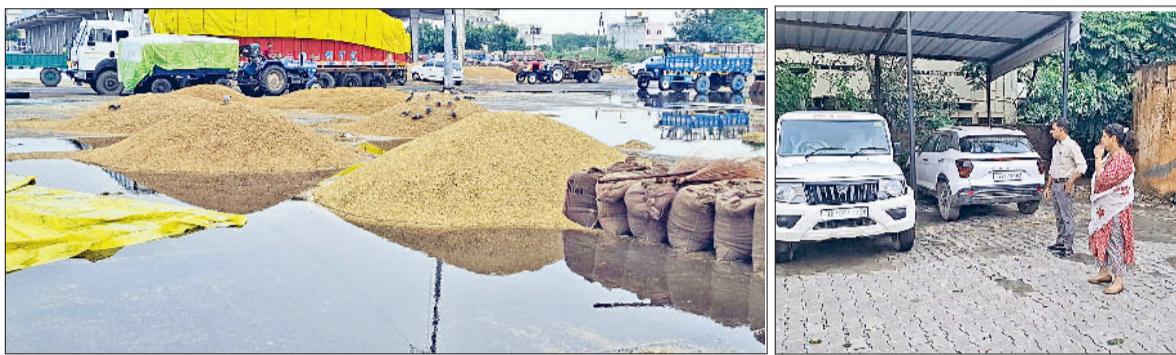
सोनीपत। बरसात का पानी जमा होने से भीगी अनाज मंडी में पड़ी फसलें।