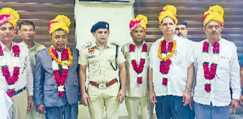
सोनीपत। सेवानिवृत्त होने वाले कर्मचारी।