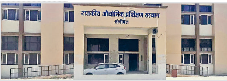
आईटीआई में 1044 सीटें थी निर्धारित

शिक्षा विशेषज्ञों का मानना है कि छात्रों का ध्यान अब परंपरिक स्नातक और आईटीआई पाठ्यक्रमों से हटकर व्यावसायिक व कौशल आधारित छोटे कौर्सों की ओर अधिक जा रहा है। वहीं कई विद्यार्थी राज्य से बाहर के विश्वविद्यालयों या निजी संस्थानों में दाखिला लेना पसंद कर रहे हैं। महाविद्यालय प्रबंधकों के आग्रह पर ही निदेशालय ने दाखिला प्रक्रिया बढ़ाने का निर्णय लिया था, लेकिन परिणाम उम्मीद के विपरीत रहे। अब दाखिला प्रक्रिया के पूर्ण हो जाने के बाद छात्र चाहकर भी किसी भी महाविद्यालय या आईटीआई में दाखिला नहीं ले पाएंगे। खाली पड़ी सीटें इस शैक्षणिक सत्र में भर नहीं पाएंगी, जिससे संस्थानों को नुकसान उठाना पड़ेगा। शिक्षा विभाग के अधिकारियों का कहना है कि यह प्रवृत्ति चिंताजनक है और अगले सत्र में दाखिला प्रक्रिया को और अधिक आकर्षक बनाने के लिए कदम उठाए जाने होंगे।